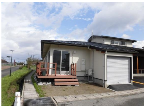
サイクリングロードに面しているため、天気の良い日は安心して散歩を楽しんでいます。