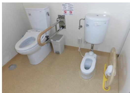
成長に合わせて使い分けができるトイレ。