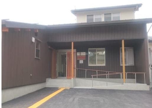
正面から見た建物です。

( http://ikushiba.sunnyday.jp/keirinhojo.html )