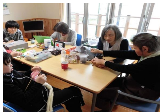
頂いたテーブルでそれぞれ出来る作業をしています。女性はおしゃべりしながら手芸をしています。全盲のご利用者もコーヒーの豆挽きで香りを楽しんで頂いています。