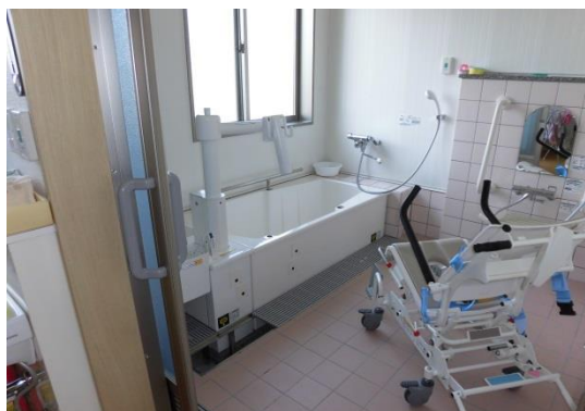
肢体不自由の方も特殊浴槽で入浴して頂けます。