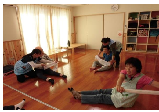
床暖房のフロアで、タオルを使ったストレッチ。機能訓練になります。