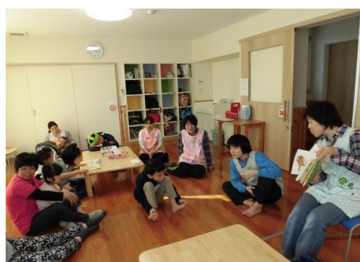
放課後は子ども達でにぎやかです。