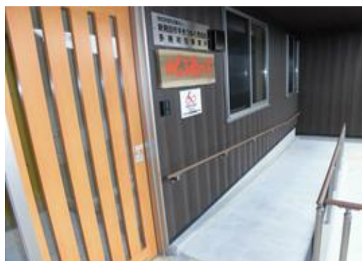
スロープと自動ドアでご利用者がスムーズに施設内に入れます。